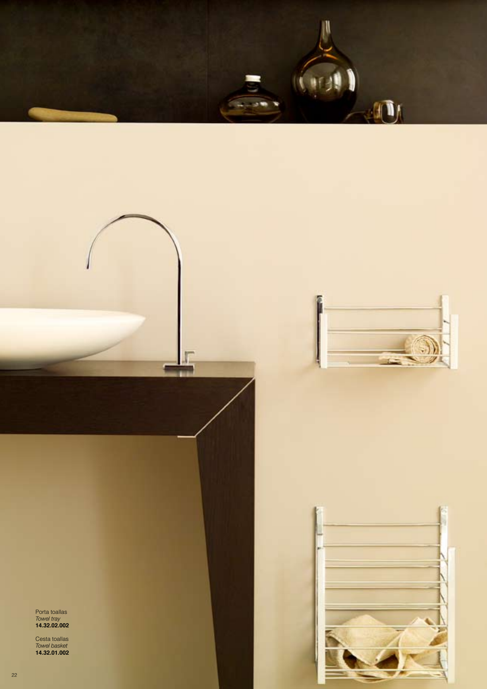
Porta toallas Towel tray 14.32.02.002