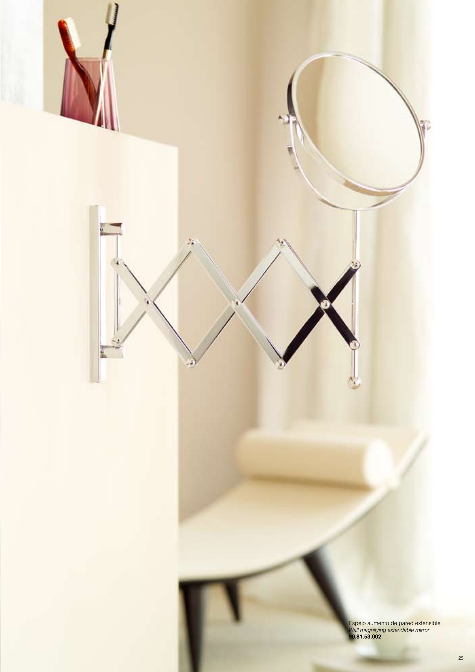
Espejo aumento de pared extensible Wall magnifying extendable mirror 90.81.53.002