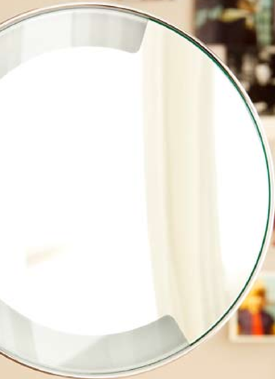
Espejo aumento de pared con luz Wall magnifying mirror w/light 90.82.50.002