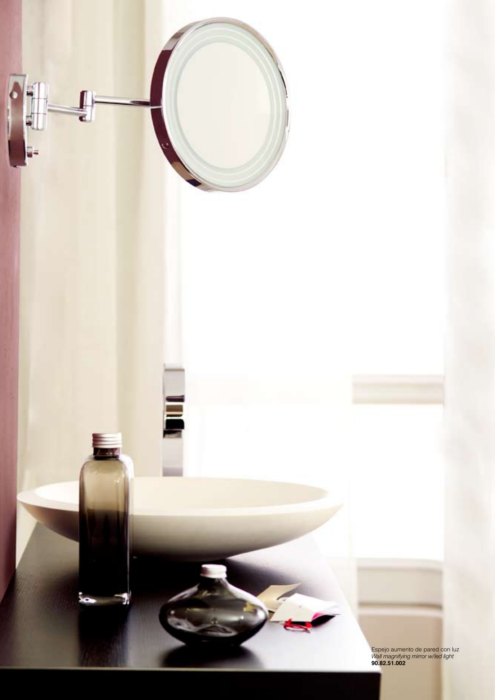
Espejo aumento de pared con luz Wall magnifying mirror w/led light 90.82.51.002