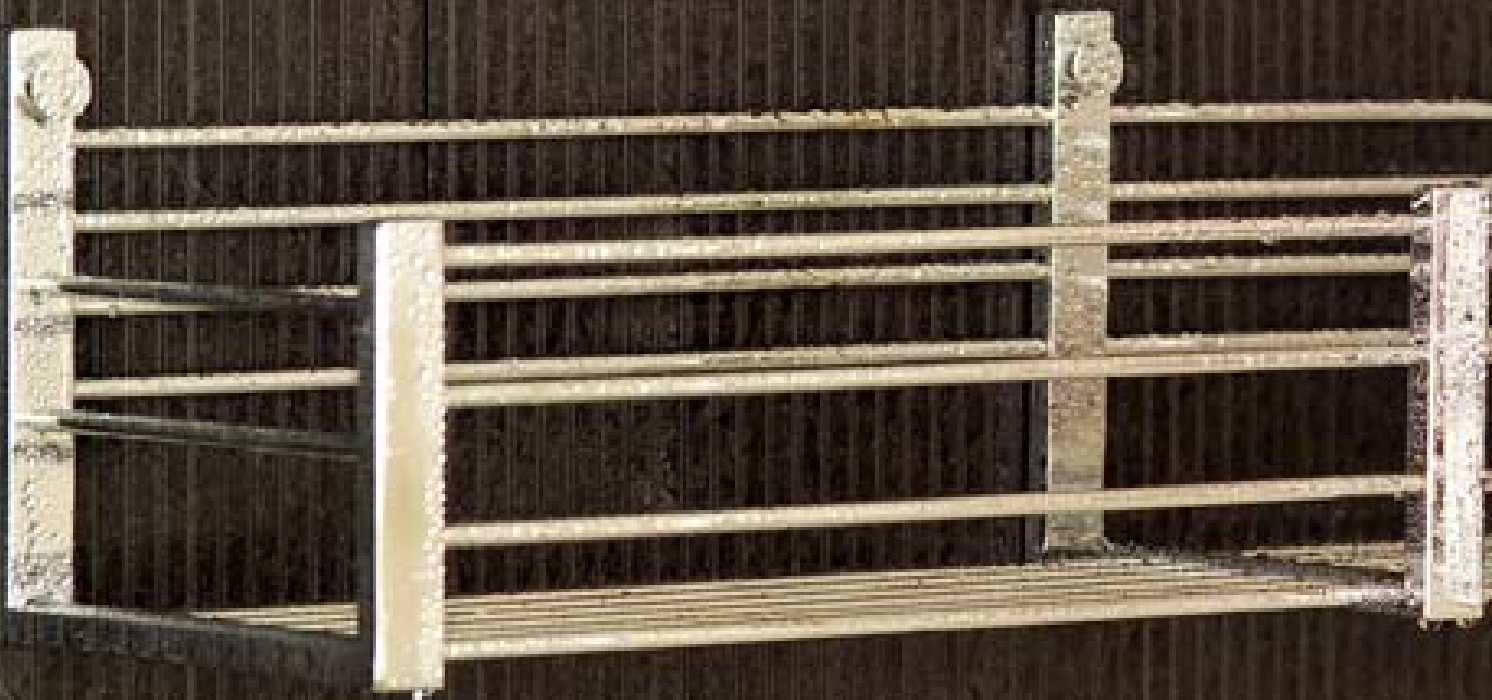
Jabonera 38x38 Corner soap tray 38x38 14.60.35.002