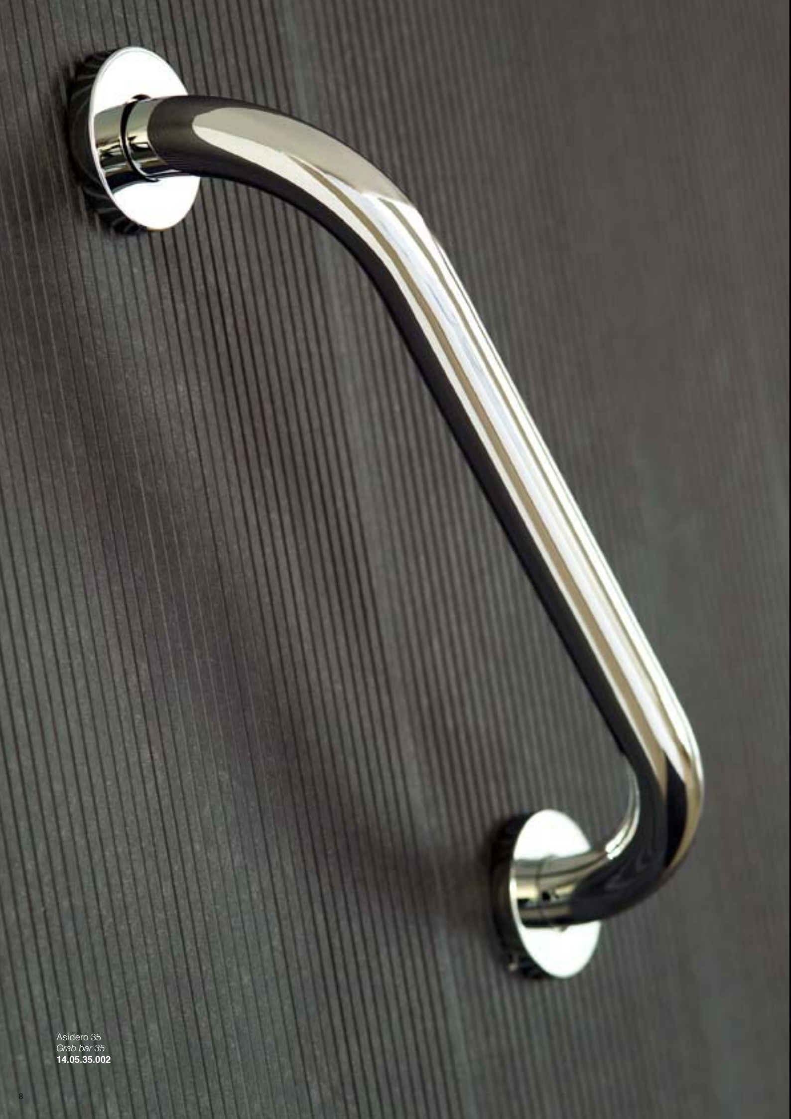
Asidero 35 Grab bar 35 14.05.35.002