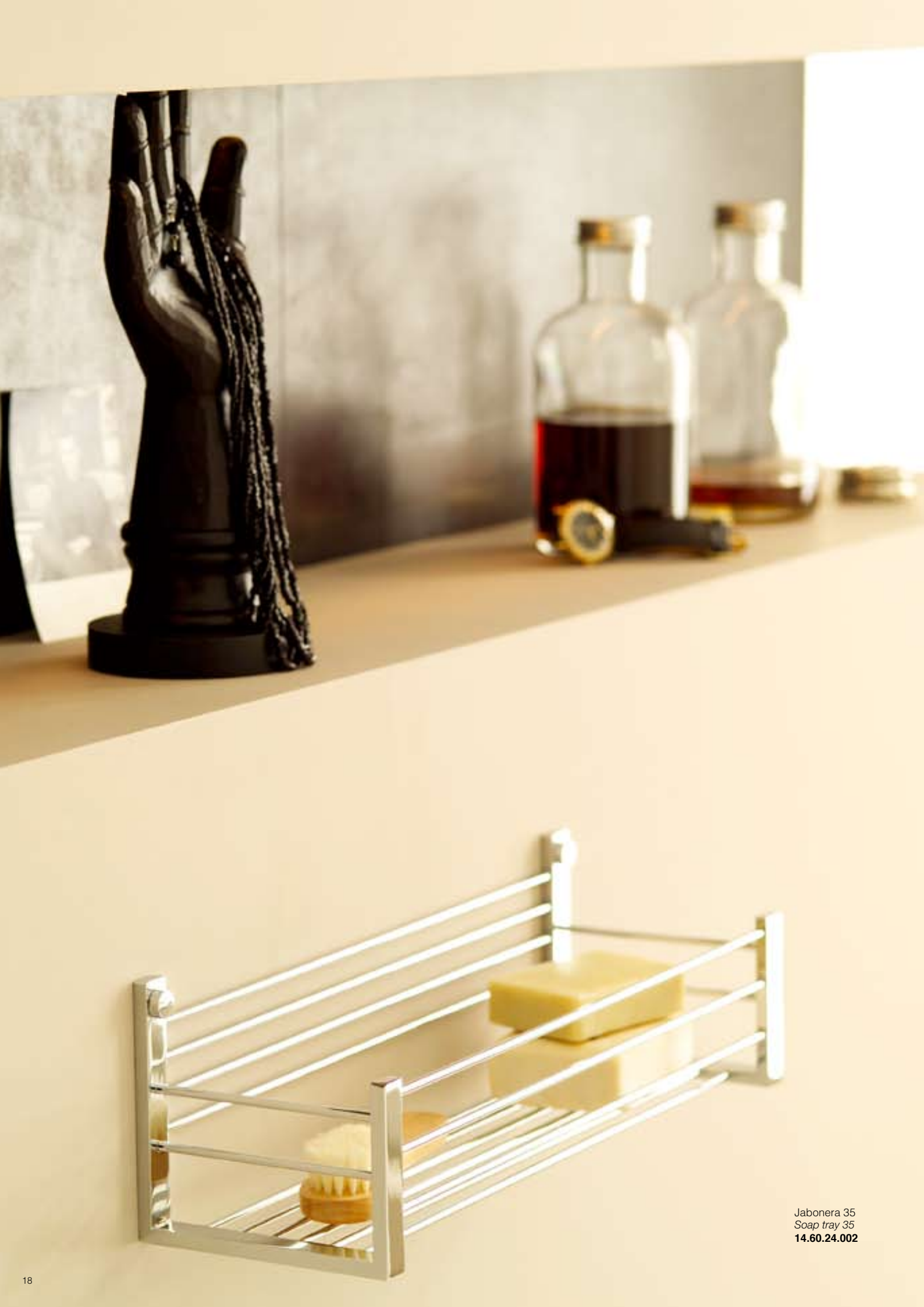
Jabonera 35 Soap tray 35 14.60.24.002