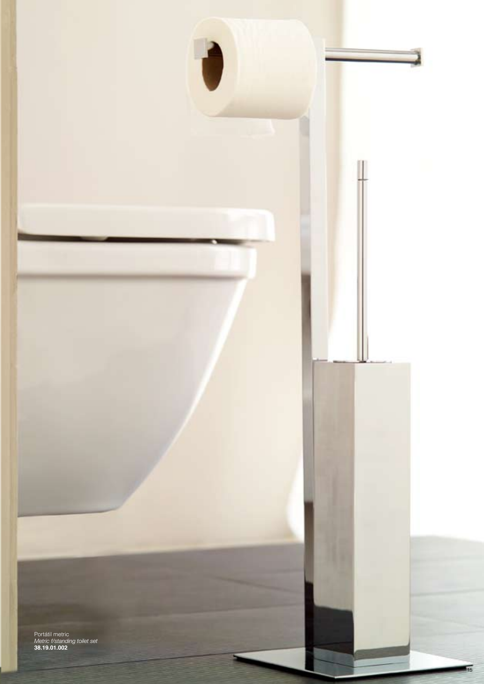
Portátil metric Metric f/standing toilet set 38.19.01.002