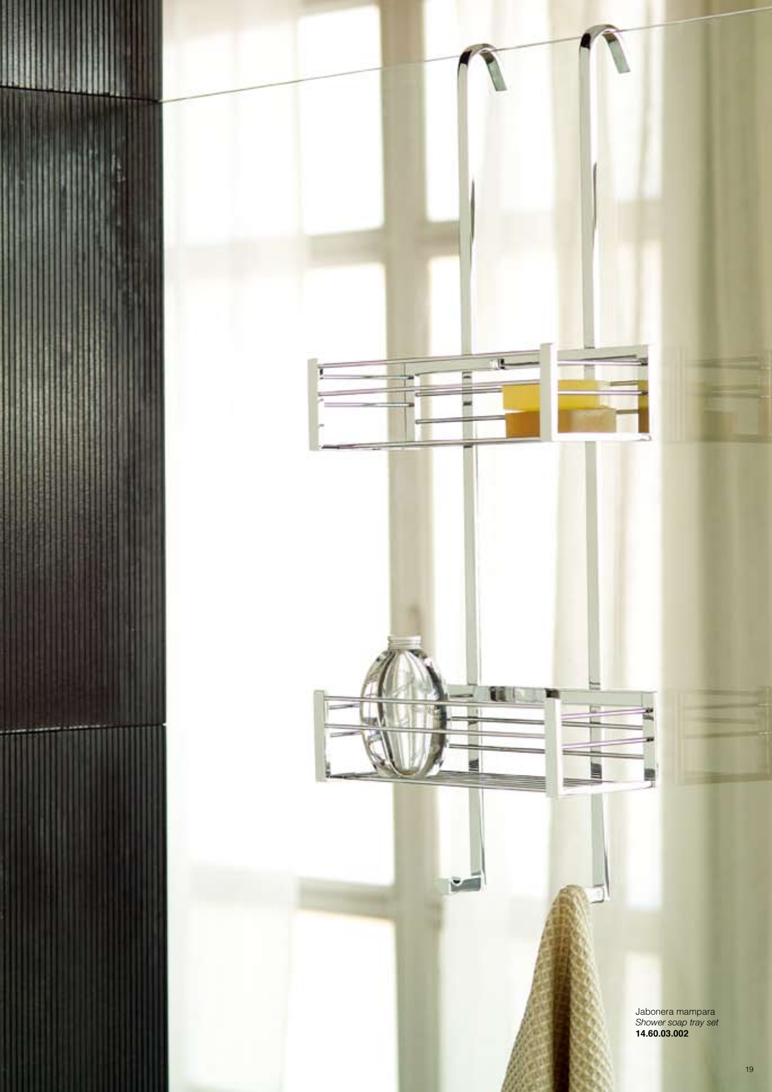
Jabonera mampara Shower soap tray set 14.60.03.002