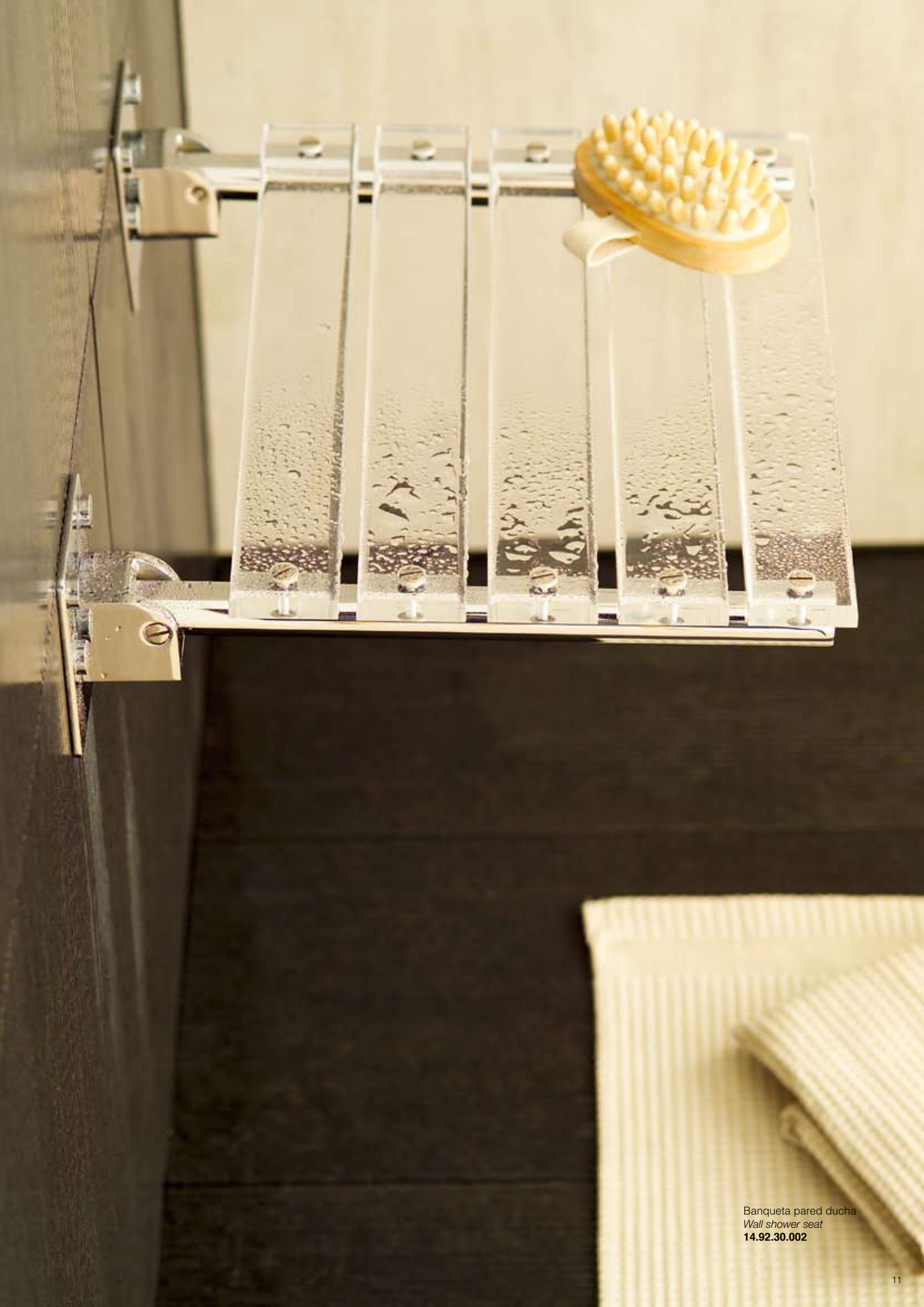
Banqueta pared ducha Wall shower seat 14.92.30.002