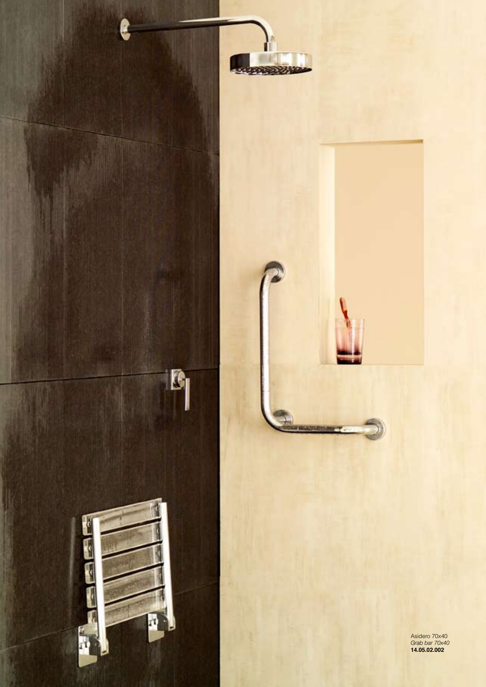
Asidero 70x40 Grab bar 70x40 14.05.02.002