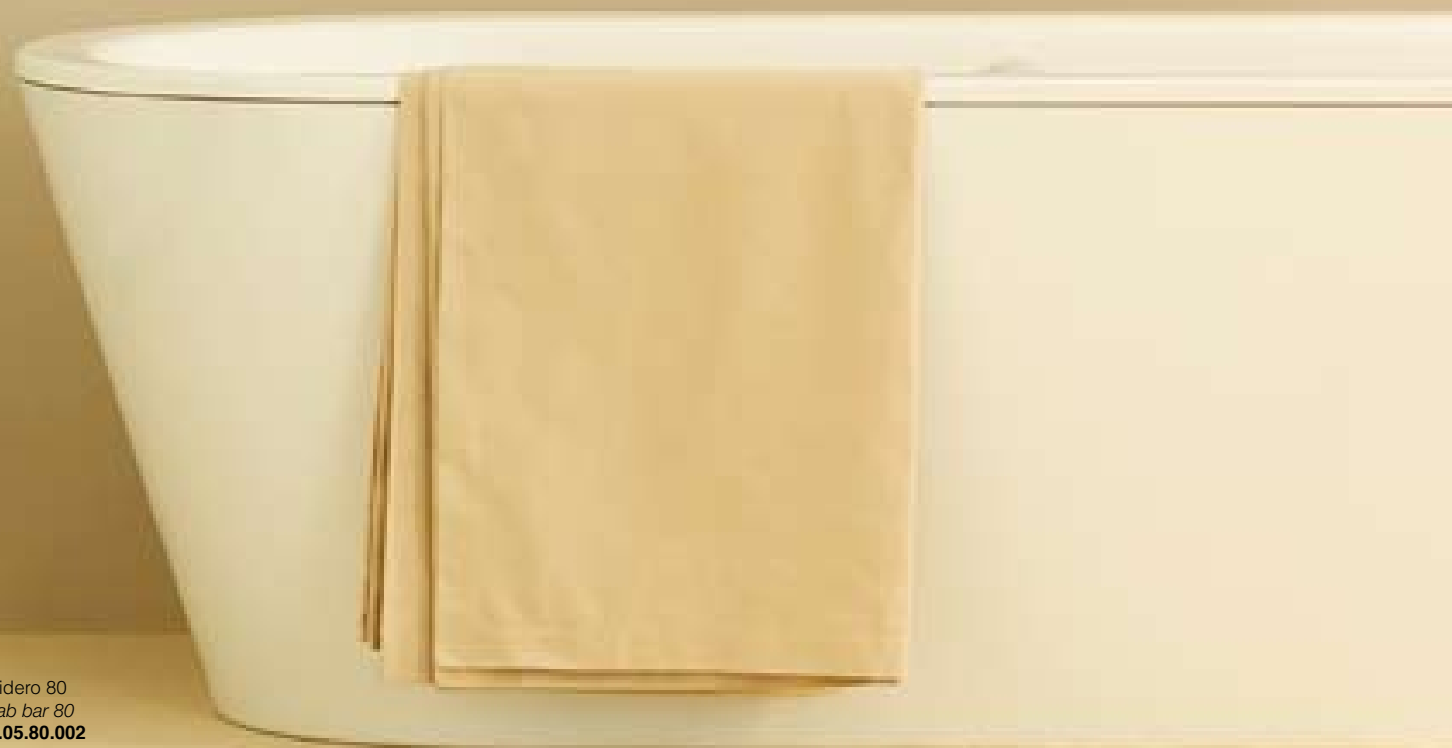
Asidero 80 Grab bar 80 14.05.80.002