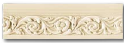
10x33,3 CLASSIC 10x2,5 CLASSIC ANGOLO