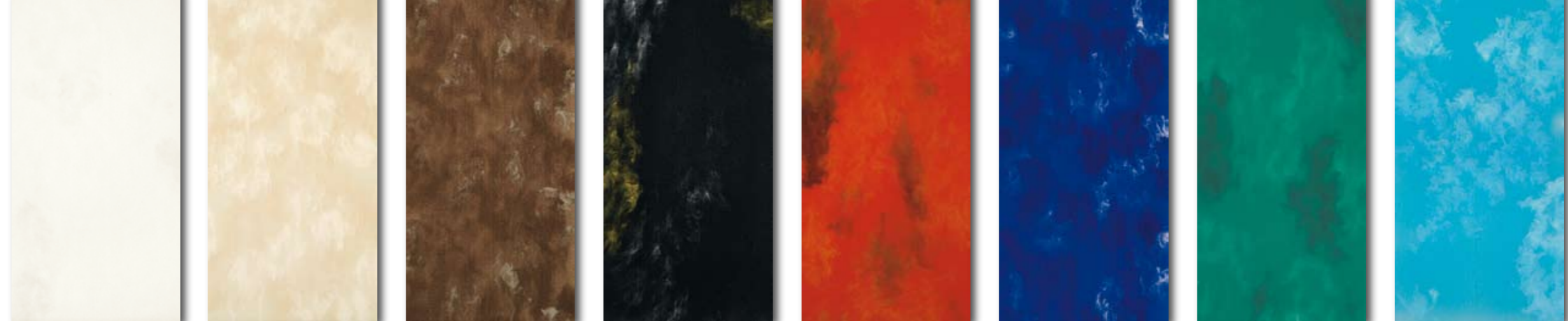
33,3x100 EGO BIANCO EGO7 107 MQ. 33,3x100 EGO BEIGE EGO6 107 MQ. 33,3x100 EGO MARRON EGO8 107 MQ. 33,3x100 EGO NERO EGO3 107 MQ. 33,3x100 EGO ROSSO EGO1 107 MQ. 33,3x100 EGO BLU EGO2 107 MQ. 33,3x100 EGO VERDE EGO5 107 MQ. 33,3x100 EGO TURCHESE EGO4 107 MQ.