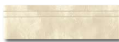
10x100 10x33,3 CLOSE