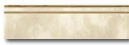
10x100 10x33,3 CLOSE ORO