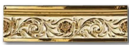
10x33,3 CLASSIC ORO 10x2,5 CLASSIC ORO ANGOLO