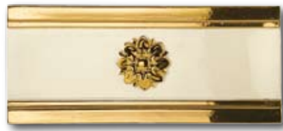
14,5x33,3 EMPIRE ORO 14,5x2 EMPIRE ORO ANGOLO