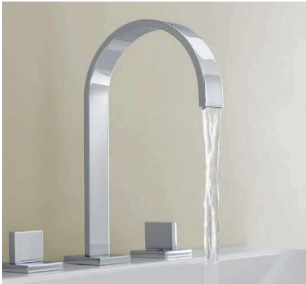
With unrestricted flow // Senza aeratore // Con caño de salida libre

A clear, pure, primeval flow. The immediate way to experience water. Un getto trasparente, puro e naturale. Il modo diretto di vivere l'acqua. Un chorro, claro, limpio y natural. La forma más directa de disfrutar del agua.