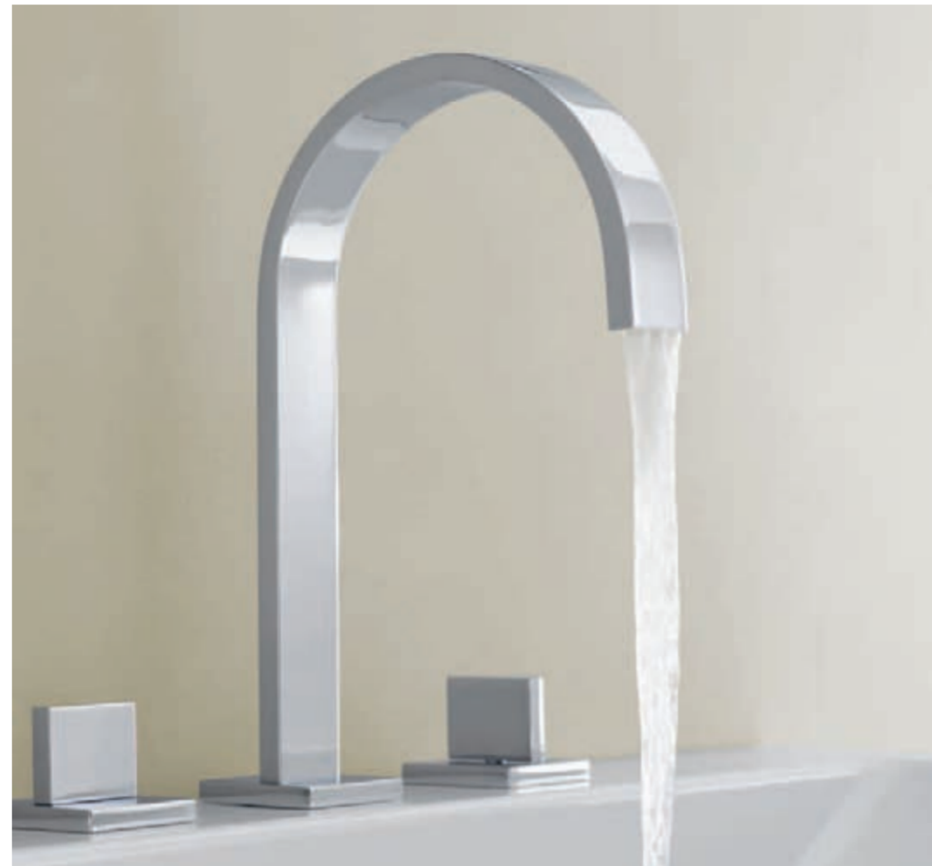
With aerator // Con aeratore // Con mezclador de aire

A clear, pure, primeval flow. The immediate way to experience water. Un getto trasparente, puro e naturale. Il modo diretto di vivere l'acqua. Un chorro, claro, limpio y natural. La forma más directa de disfrutar del agua.