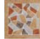
A.BAYONNE 22x22 - 8.6" x 8.6"