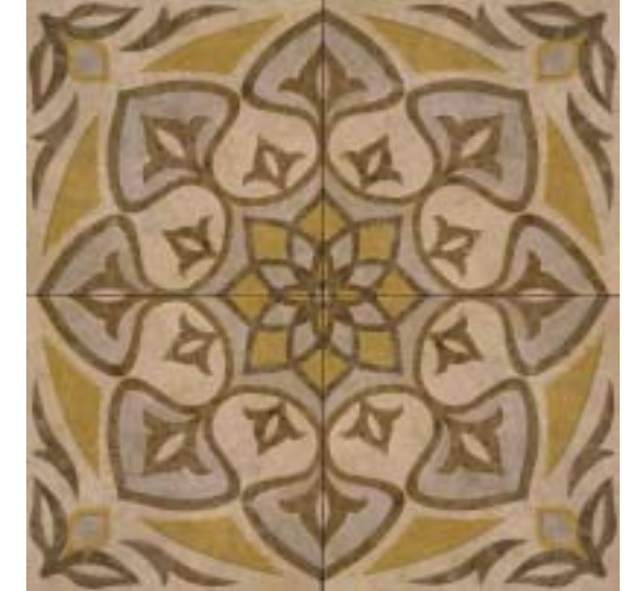
ROS.ROCH.44B 88x88 - 34.6" x 34.6"