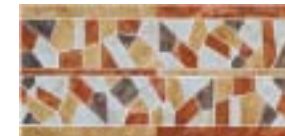
L.BAYONNE 44 22x44 - 8.6" x 17.3"