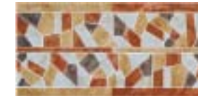
L.BAYONNE 44 22x44 - 8.6" x 17.3"