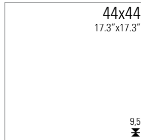
ROCHELLE 44M LP PEI 4