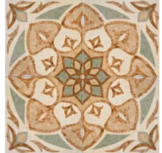
ROS.ROCH.44A 88x88 - 34.6" x 34.6"