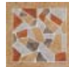
A.BAYONNE 22x22 - 8.6" x 8.6"