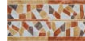
L.BAYONNE 44 22x44 - 8.6" x 17.3"