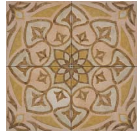
ROS.ROCH.44T 88x88 - 34.6" x 34.6"