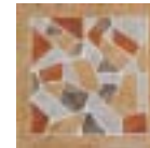
A.BAYONNE 22x22 - 8.6" x 8.6"