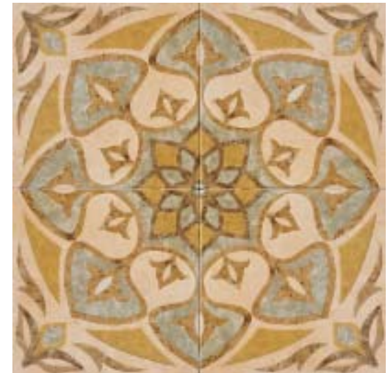
ROS.ROCH.44M 88x88 - 34.6" x 34.6"